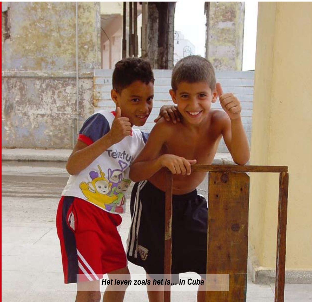
Het leven zoals het is... in Cuba

arbeiders steunen in een "andere" wereld