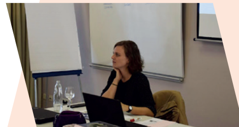
Hannah Arendt Instituut